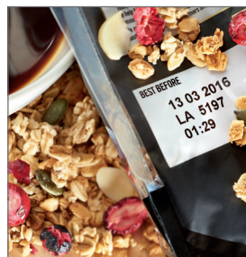
Эффективное сервисное обслуживание, гарантирующее время работы принтера и качество маркировки продукции.

* По сравнению с конкурирующими моделями.