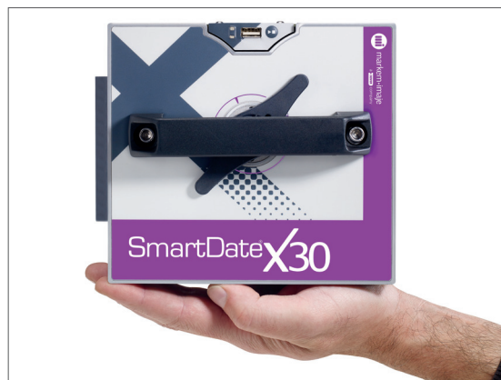
Компактный размер для простоты интеграции. SmartDate X30 – самый маленький из принтеров серии SmartDate

Единый доступ для получения экспертной поддержки как по маркировщикам, так и по расходным материалам.