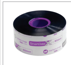
Выбор из трех типов лент и серии аксессуаров в зависимости от Ваших потребностей и типа упаковки.